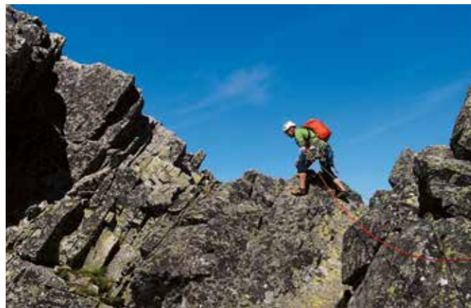
Lehký dolez po hřebínku na vrchol