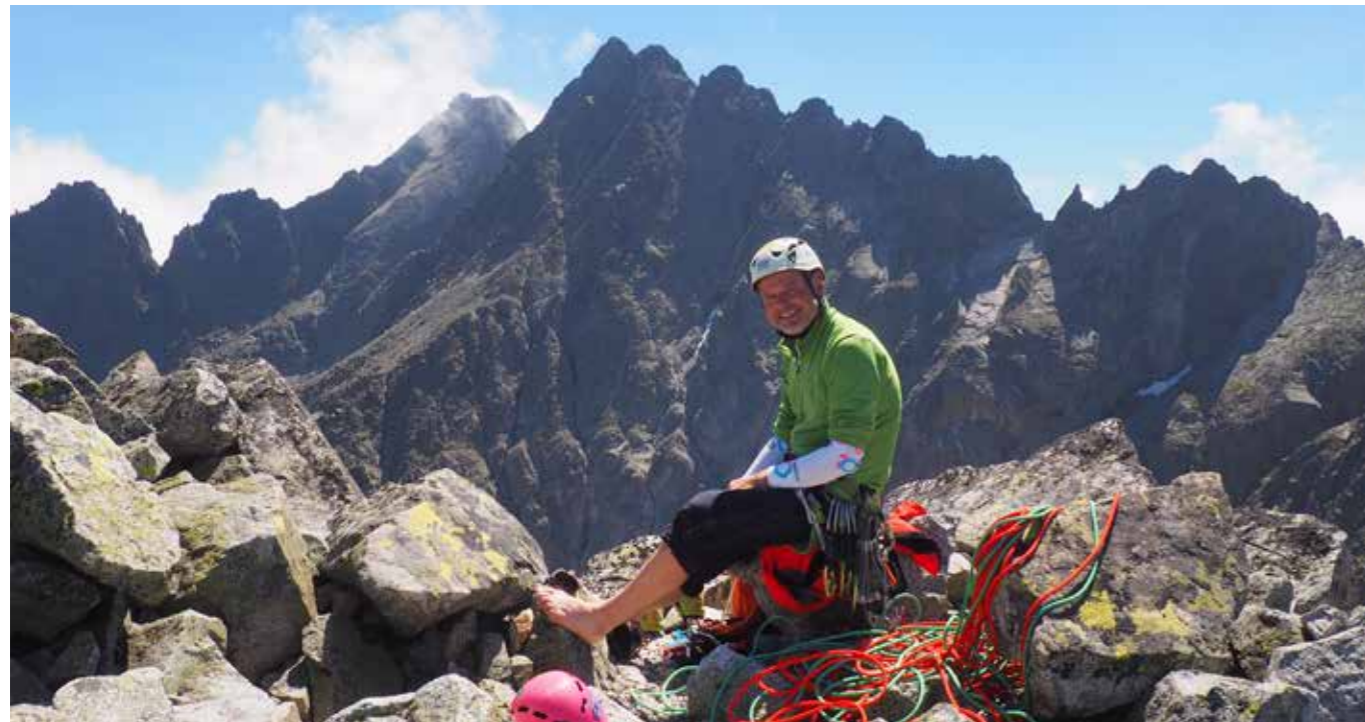
Z vrcholu je třeba sestoupit orientačně náročnějším terénem