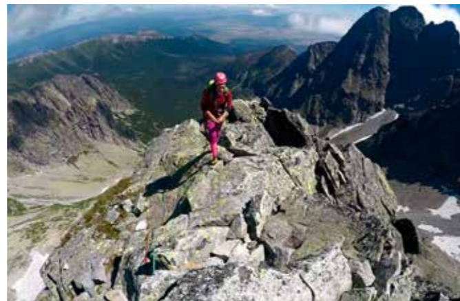
Poslední metry na vrchol Černého štítu